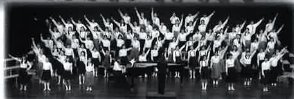
〔共演〕岡崎ジュニアコーラス「ジョリフィユ」

今回、クリスマスを彩る名曲をお贈りします！天使たちの清らかな歌声に包まれて、やすらぎのひとときをお過ごしください。