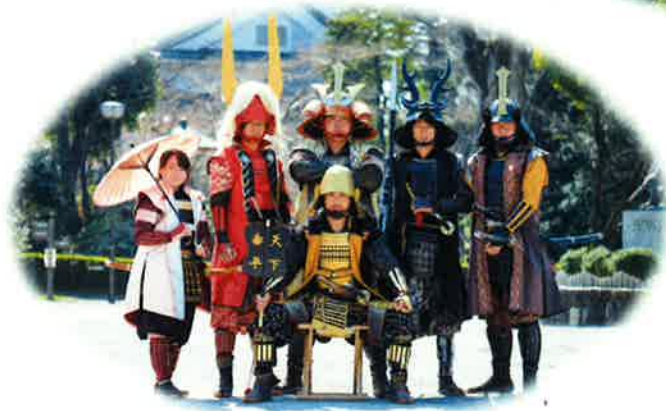
グレート家康公「葵」武将隊