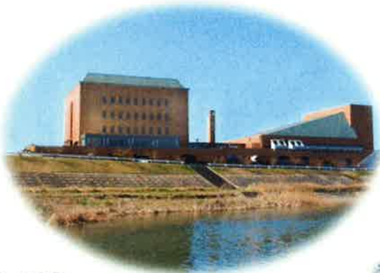
岡崎市奄美丘会館