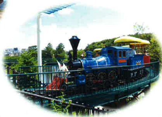
南公園 ゆめほっぽ