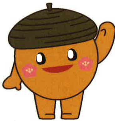
南公園オリジナルキャラクター「みなどん」