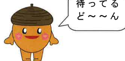
南公園オリジナルキャラクター 「みなどん」